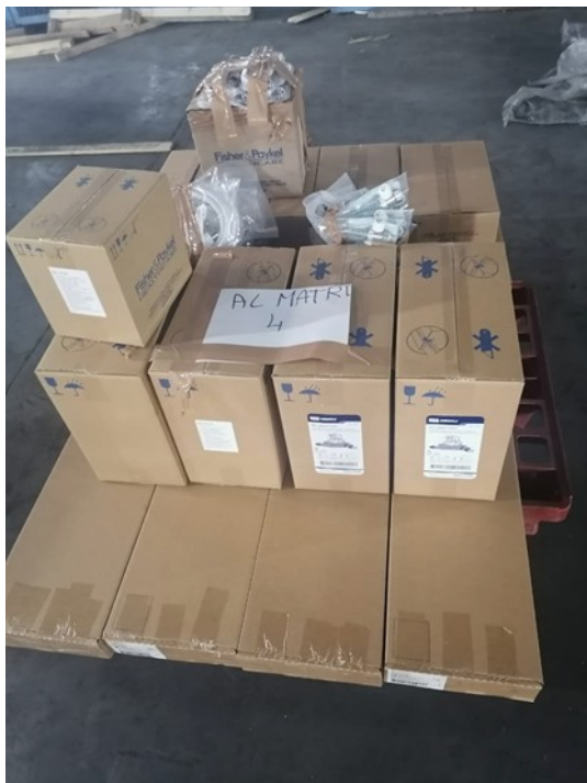
Teil der Sachspenden

Städtepartnerschaft Schöningen – Beni Hassen/Sousse